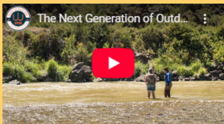
Academia al Aire Libre

Para ver ejemplos de programas elegibles, lea sobre asignaciones anteriores de la subvención o vea los siguientes vídeos.